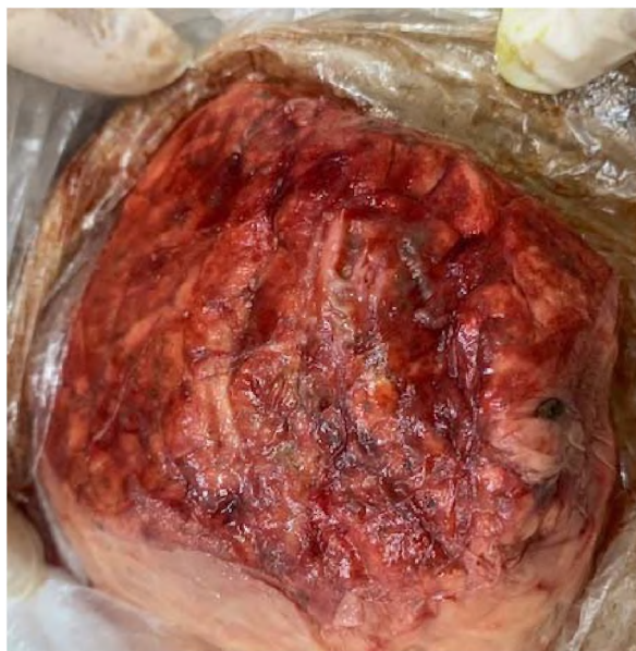
Рисунок 3 – Кровоизлияния в легких коровы при лептоспирозе

В легких наблюдаются кровоизлияния, заполнение полостей серозно-геморрагическим экссудатом (Рис.3).