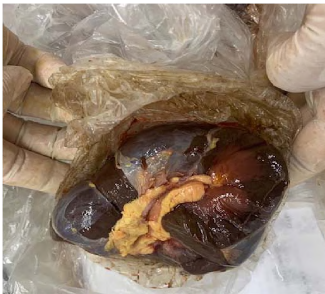
Рисунок 2 – Почка павшей от лептоспироза коровы

Почки увеличены в объеме, капсула снимается легко, поверхность долек гладкая, нередко отмечаются неравномерное кровенаполнение или мелкопятнистые кровоизлияния в корковом слое. Консистенция органа дряблая, ломкая (Рис.2).