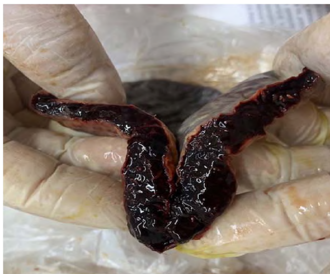
Рисунок 4 – Патологоанатомические изменения в селезенке коровы при лептоспирозе

Селезенка дряблая, темно-бордового цвета, структура сглажена, имеет кашицеобразную консистенцию (Рис.4).