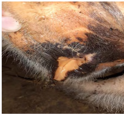
Рисунок 5 – Желтушность серозных и слизистых оболочек при лептоспирозе