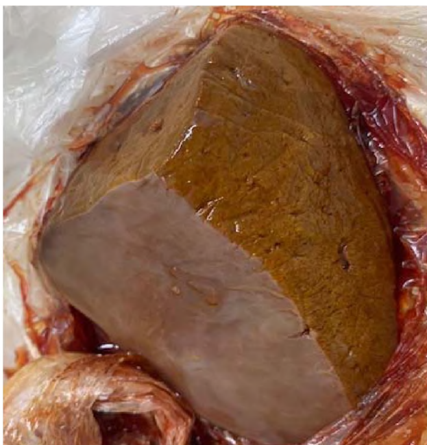
Рисунок 1 – Патологоанатомические изменения в печени павшей от лептоспироза коровы

Патологоанатомические изменения были выражены в печени и характеризовались изменением цвета органа до глинисто-желтого, увеличением в объеме, дряблостью консистенции печеночной ткани. Под капсулой и на разрезе были заметны мелкие некротические участки, окрашенные интенсивнее по сравнению с неизменной паренхимой. Ткань органа в некоторых местах упругая и ломкая (Рис.1).