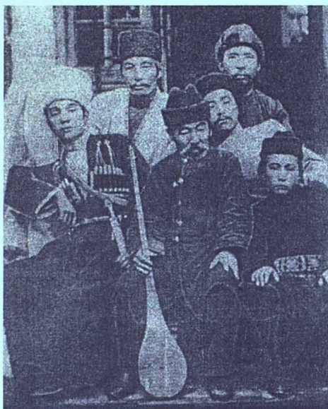
Ғабдол-Ҳакім Бөкейханов (сол жақта). Орда, XX з. 10-шы эжс. ш.