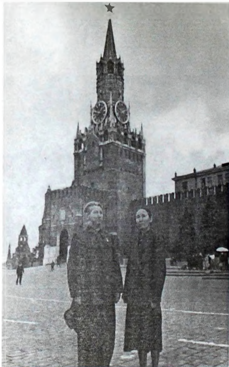
Москва. Ерлік жолын еске алған сәт.