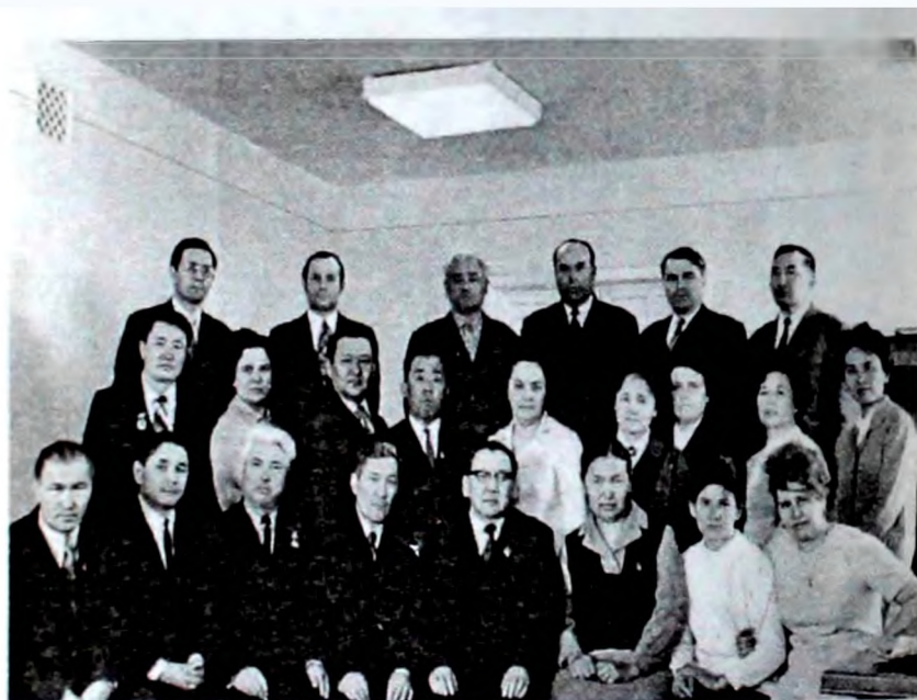
Ұлағатты ұстаздар қауымы.