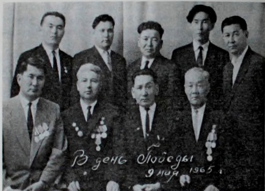
Ұлы Отан соғысының Жеңісіне 30 жыл. Майдандас достар арасында.