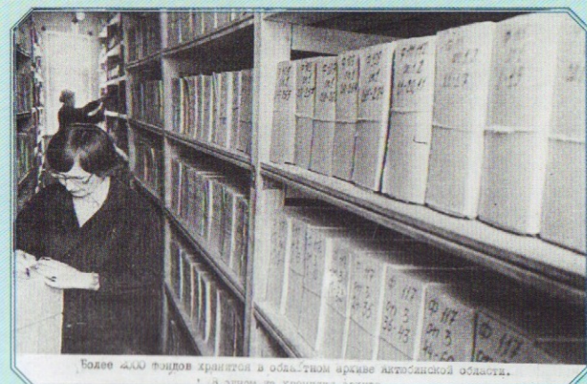
Более 4000 фондов хранится в областном архиве Актөбінской области.