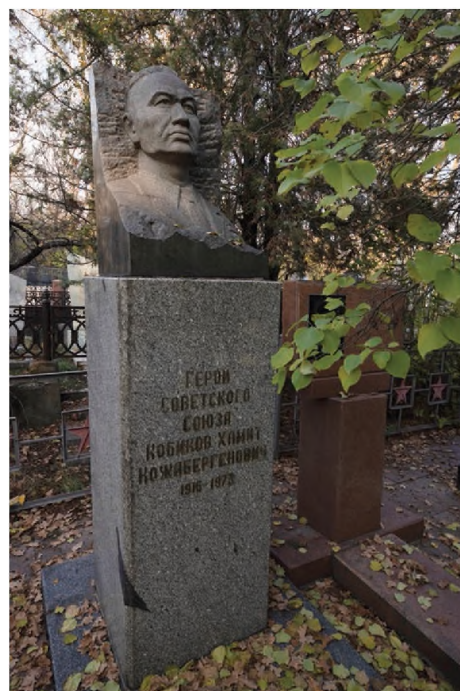
2. Надгробие Героя Советского Союза Х. К. Кобикова. Скульптор Х. И. Наурызбаев. Фото: Андрей Лунин, 2023 г.