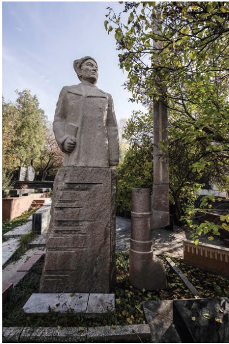
4. Надгробие Героя Советского Союза Б. Момышулы. Скульптор П. И. Шорохов. Фото: Андрей Лунин, 2023 г.