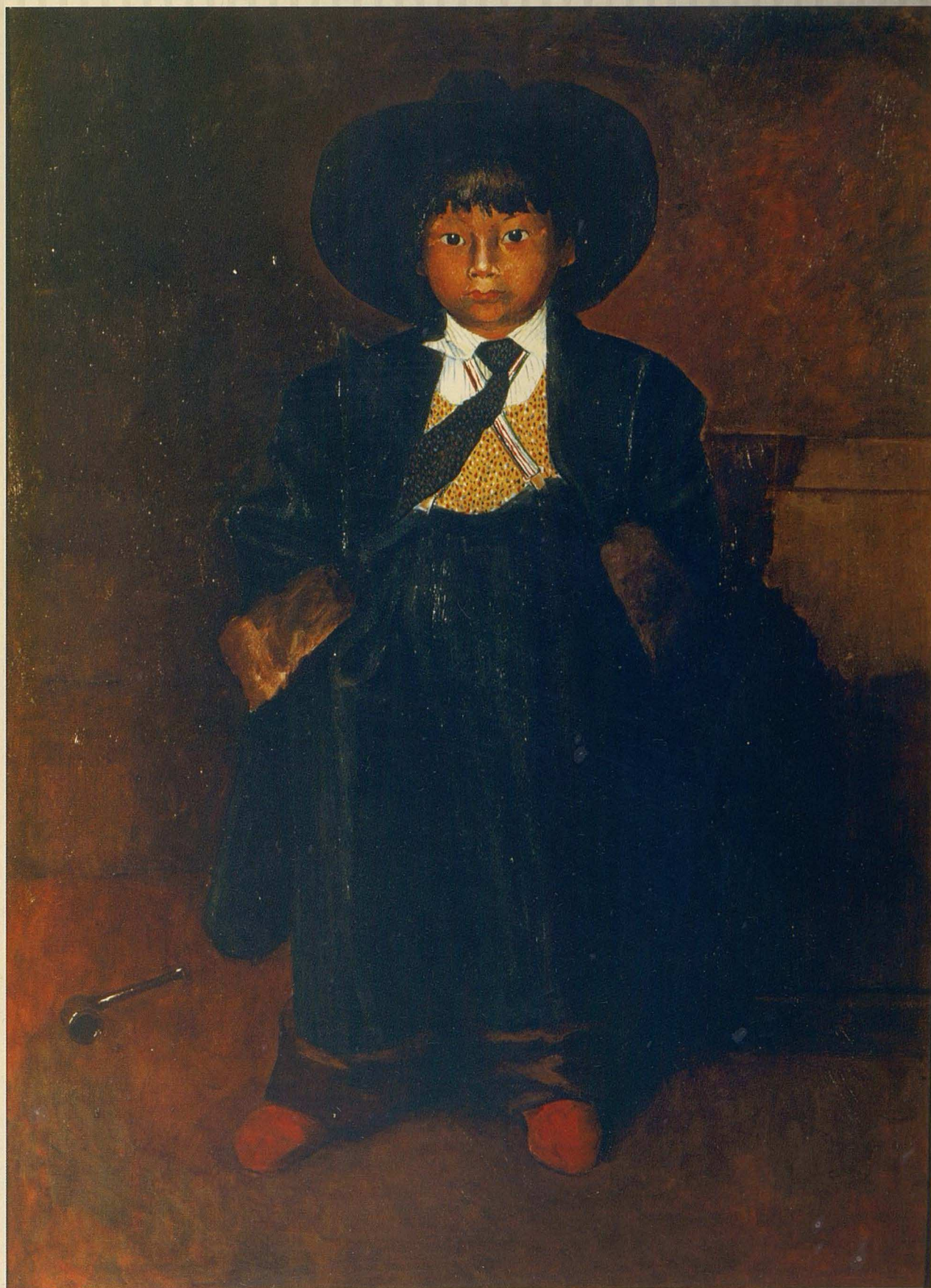
Әкесіндей. 1985. Кенеп, майлы бояу. 121x88 Как папа. 1985. Холст, масло. 121x88 As father. 1985. Canvas, oil. 121x88