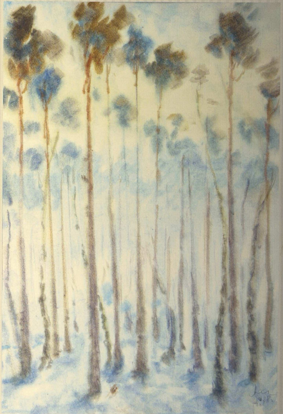
Ызғарлы таң. 1978. Қағаз, акварель. 70x46 Морозное утро. 1978. Бумага, акварель. 70x46 Frosty morning. 1978. Paper, water color. 70x46