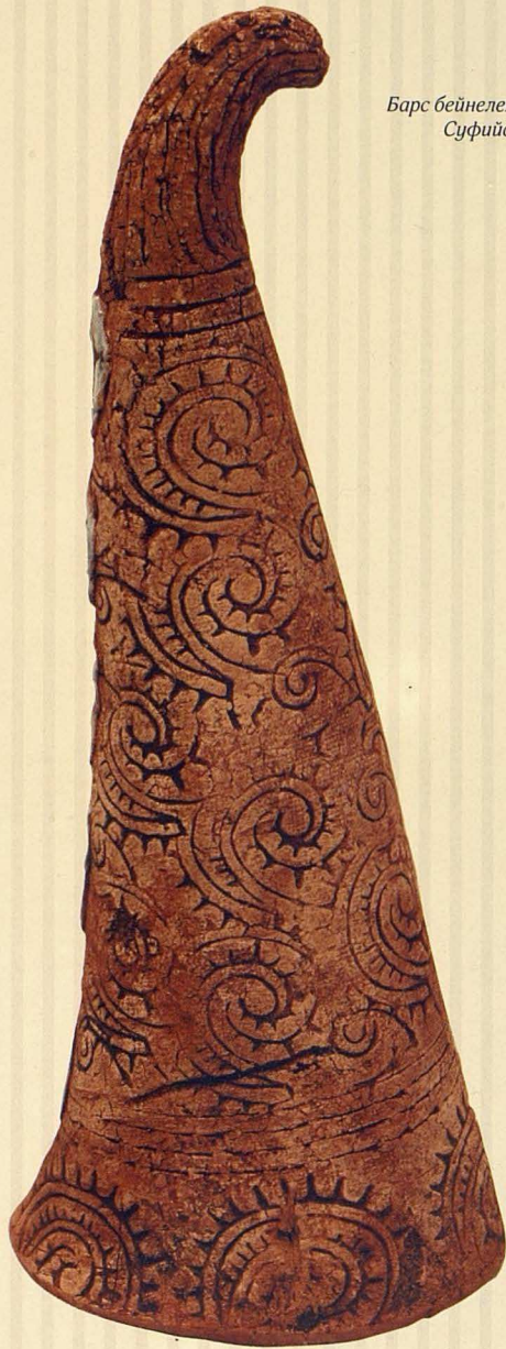
Сопы қалпағы. 2005. Қыш, глазурьлер. 35x15x15 Суфийский колпак. 2005. Глина, глазури. 35x15x15 Sufi cap. 2005. Clay, glazes. 35x15x15