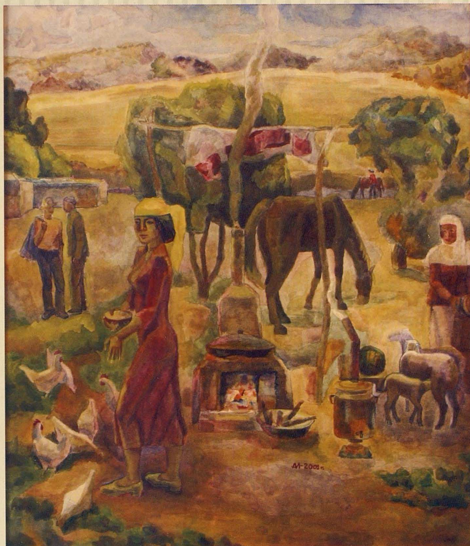
Бибі. 2001. Қараз, акварель. 70x60 Хозяйка. 2001. Бумага, акварель. 70x60 Hostess. 2001. Paper, water color. 70x60