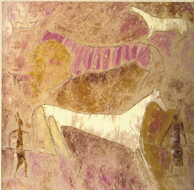
Айтпа. 2005. Кенеп, майлы бояу. 60x60 Кони. 2005. Холст, масло. 60x60 Horses. 2005. Canvas, oil. 60x60