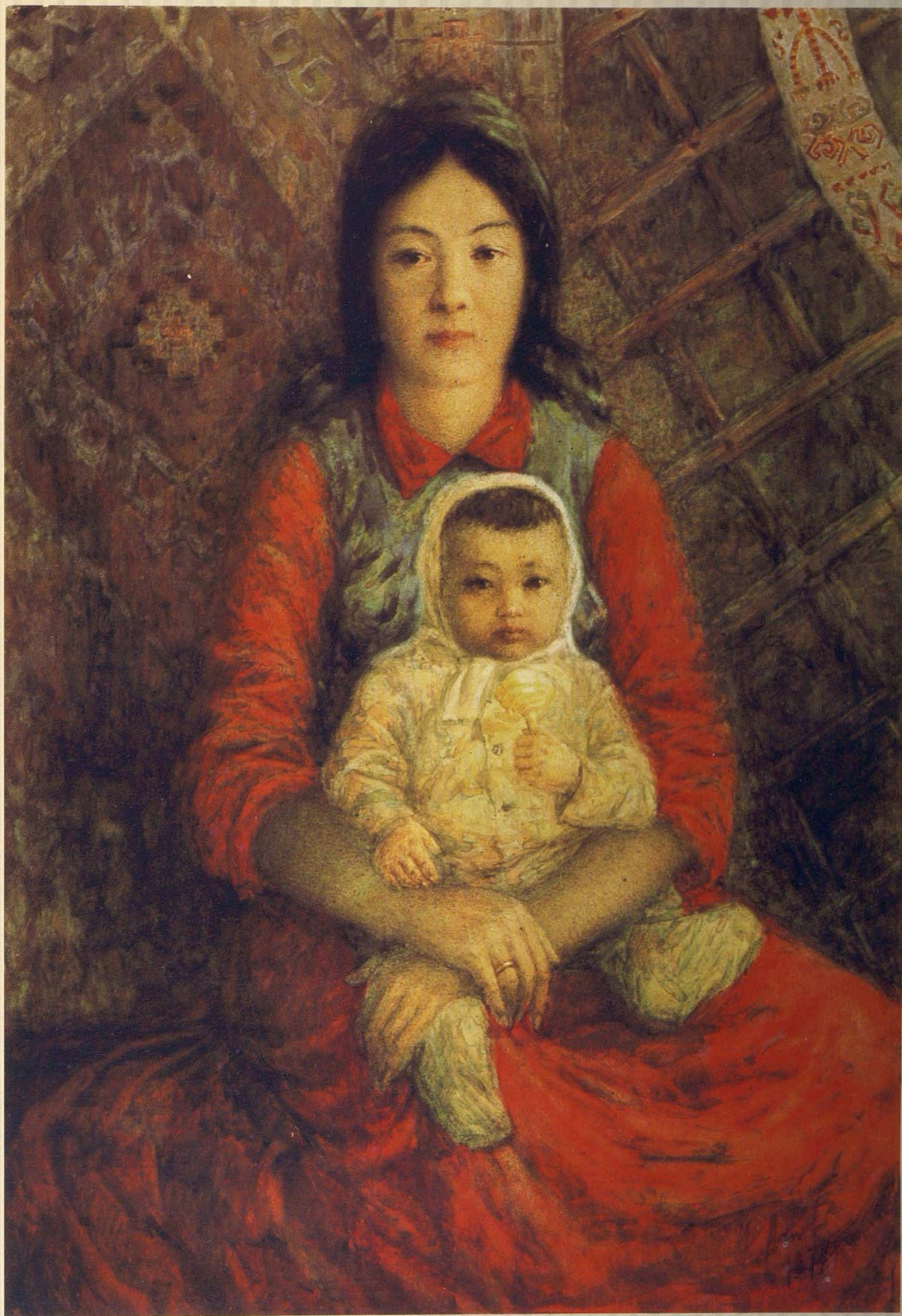
Қазақ мадоннасы. «Тың құрдастары» сериясынан. 1978–1979. Қағаз, акварель. 83х59 Казакская мадонна. Из серии «Ровесники целины». 1978–1979. Бумага, акварель. 83х59 Kazakh Madonna. From the series «Virgin land contemporaries». 1978–1979. Paper, water color. 83x59