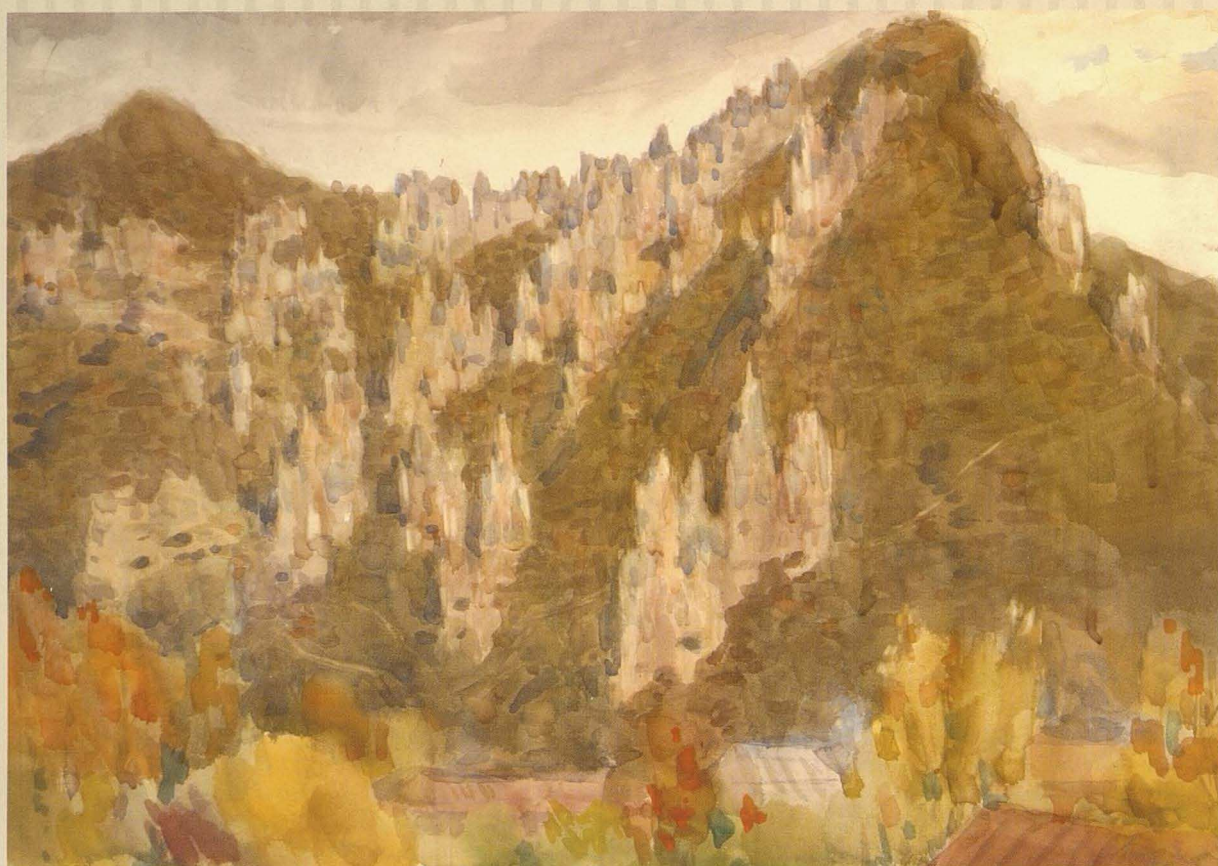
Зангизур. Армения. 1983. Қараз, акварель. 49x69 Зангизур. Армения. 1983. Бумага, акварель. 49x69 Zanzigur. Armenia. 1983. Paper, water color. 49x69