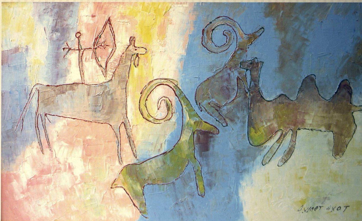
Арқарлар. 2005. Кенеп, майлы бояу. 42x72 Архари. 2005. Холст, масло. 42x72 Argali. 2005. Canvas, oil. 42x72