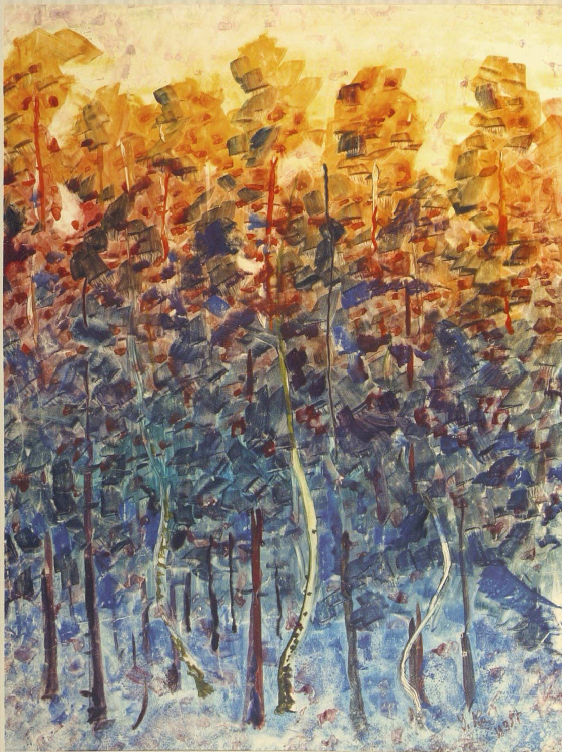
Ақтық сәуле. 1998. Қағаз, акварель. 69x52 Последний луч. 1998. Бумага, акварель. 69x52 Last beam. 1998. Paper, water color. 69x52