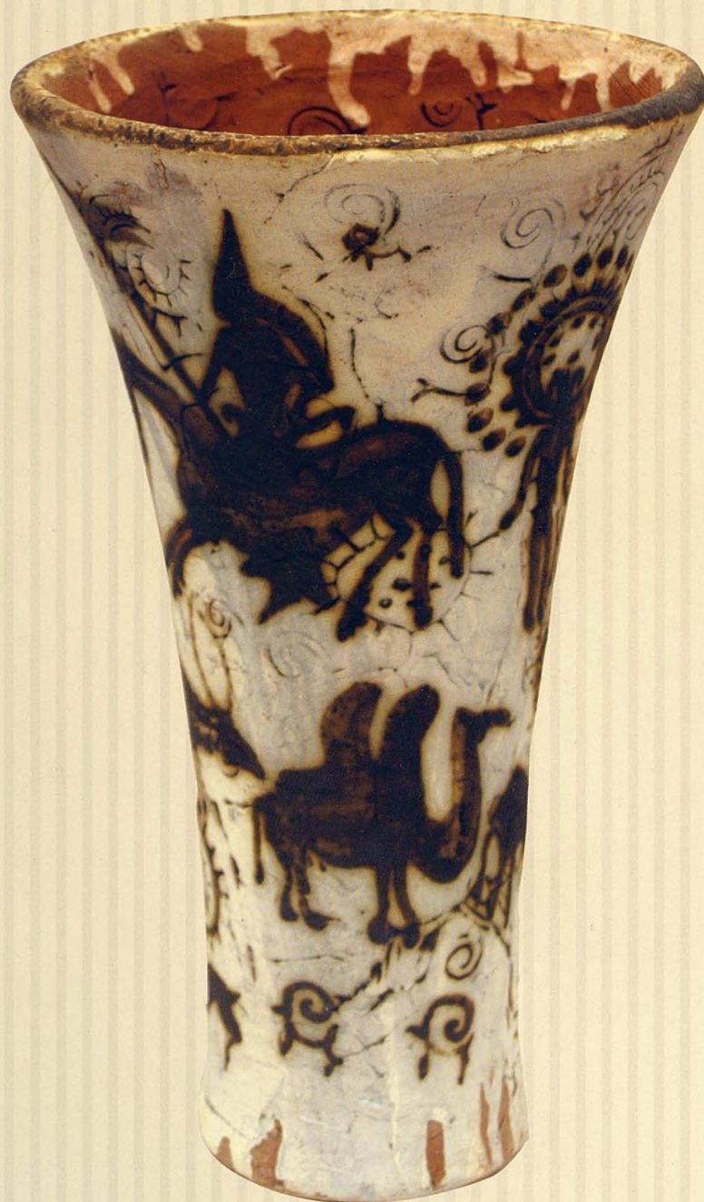
Жартас суреттері бейнеленген қумыра. 2005. Қыш, глазурьлер. 37x17x17 Ваза с наскальными рисунками. 2005. Глина, глазури. 37x17x17 Vase with petroglyphic pictures. 2005. Clay, glazes. 37x17x17