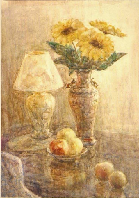
Шаммен натюрморт. 2002. Қағаз, акварель. 75x55 Натюрморт с лампой. 2002. Бумага, акварель. 75x55 Still life with a lamp. 2002. Paper, water color. 75x55