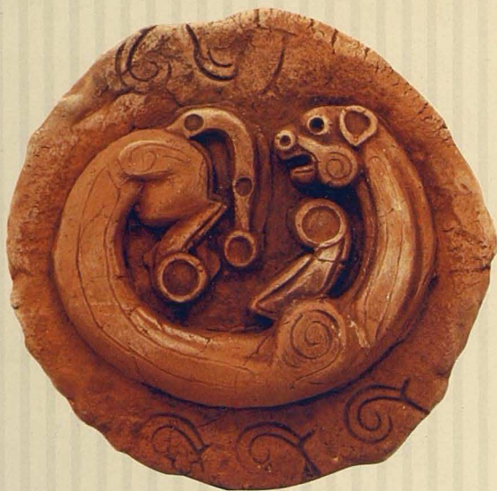
Барс. 2005. Қыш, глазурьлер. 12x12x1 Барс. 2005. Глина, глазури. 12x12x1 Panther. 2005. Clay, glazes. 12x12x1