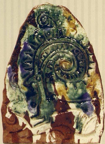
Арқарлар. 2005. Қыш, глазурьлер. 10x8x1 Архары. 2005. Глина, глазури. 10x8x1 Argali. 2005. Clay, glazes. 10x8x1