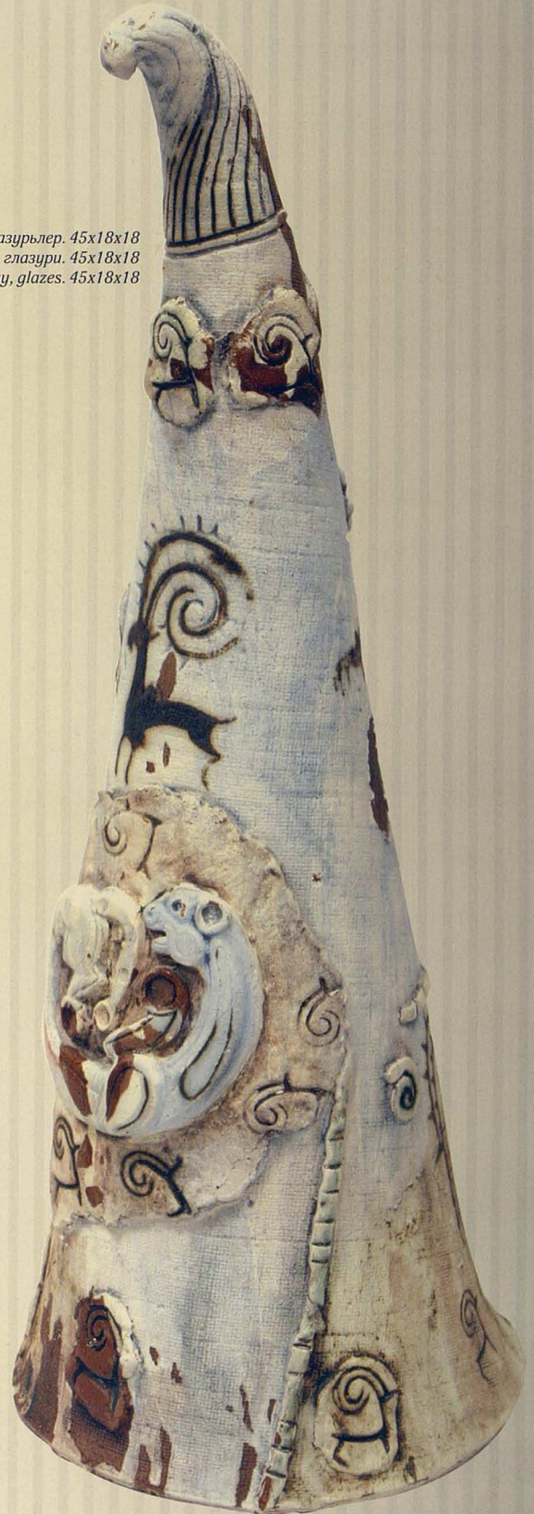
Барс бейнеленген сопы қалпағы. 2005. Қыш, глазурьлер. 45x18x18 Суфийский колпак с барсом. 2005. Глина, глазури. 45x18x18 Sufi cap with a panther. 2005. Clay, glazes. 45x18x18