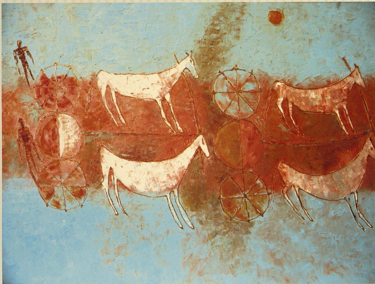
Сағым керуен. 2005. Кенеп, майлы бояу. 100x80 Мираж караван. 2005. Холст, масло. 100x80 Mirage caravan. 2005. Canvas, oil. 100x80