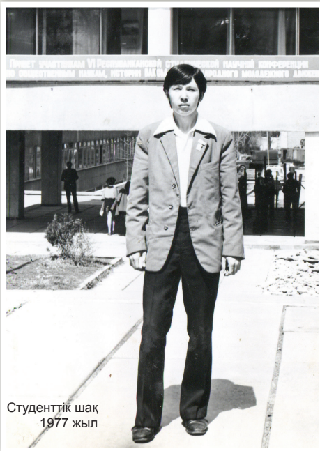
Студенттік шақ 1977 жыл