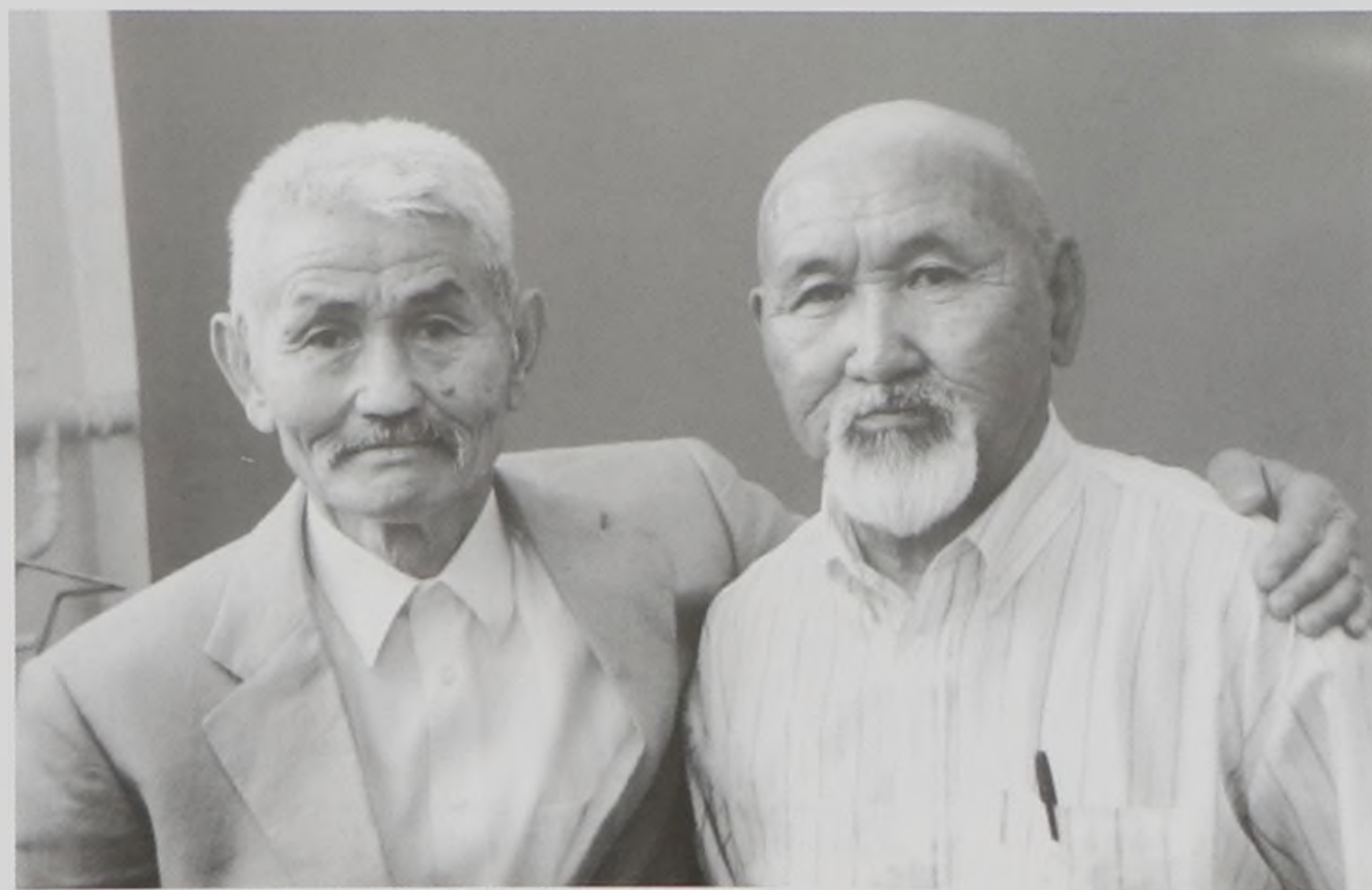
Умэлспен бірге. 2000 ж