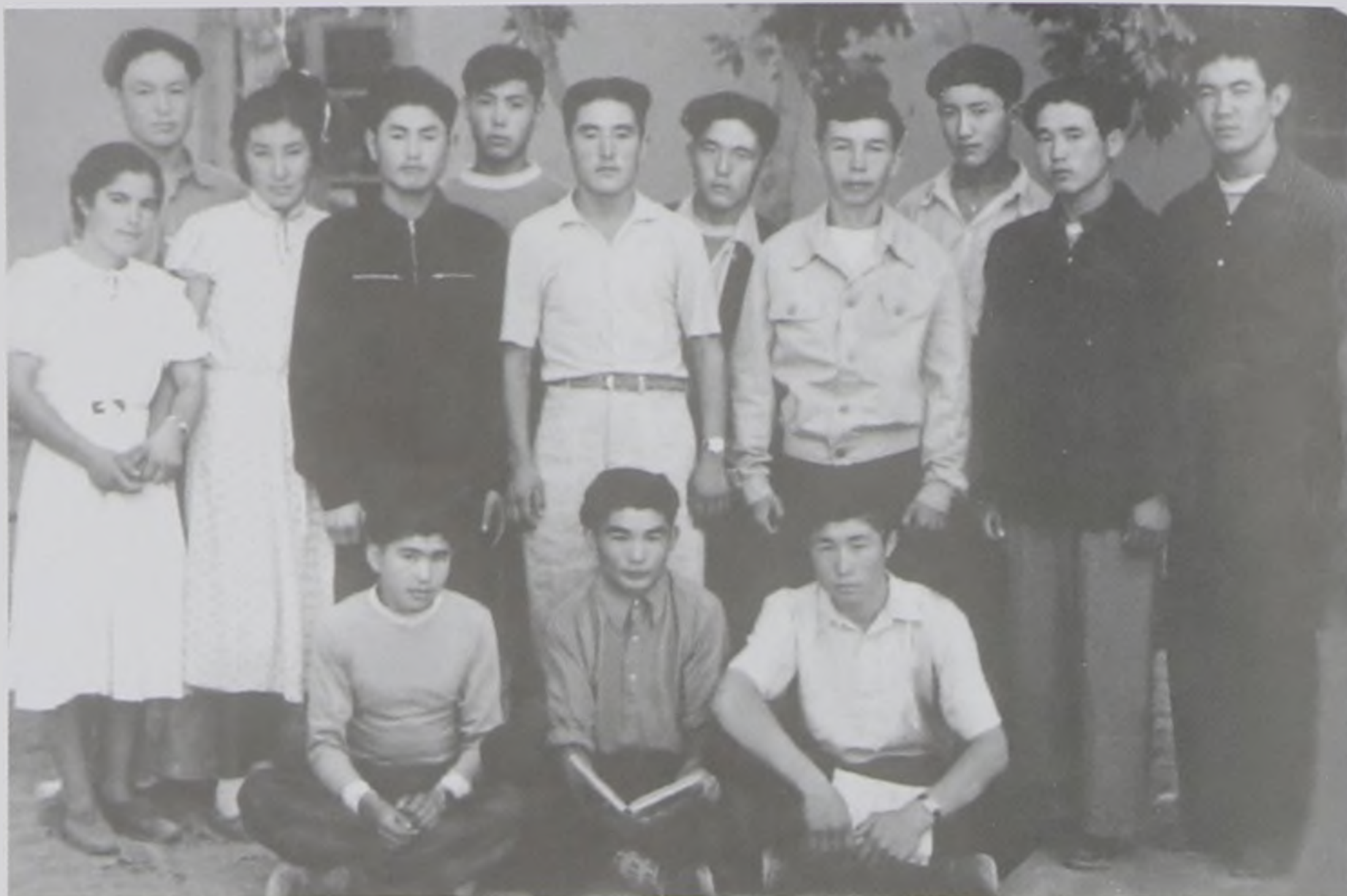
Жамбыл қаласындағы кой шаруашылығының бригадирлік мамандығының студенттерімен бірге. 1958 ж.