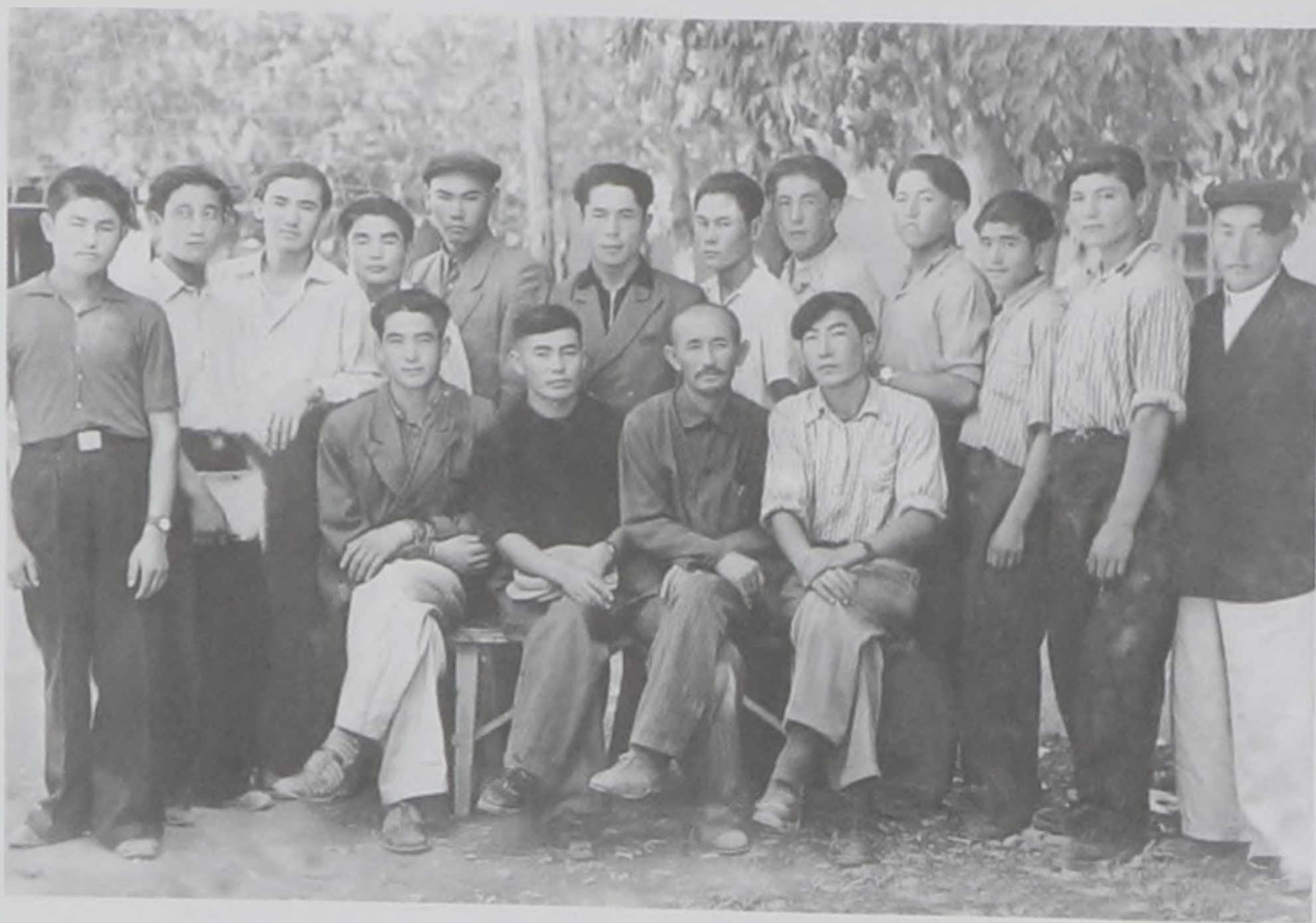
Жамбылдағы ауылшаруашылық мектепте бірге оқыған жолдастары. 1958 ж