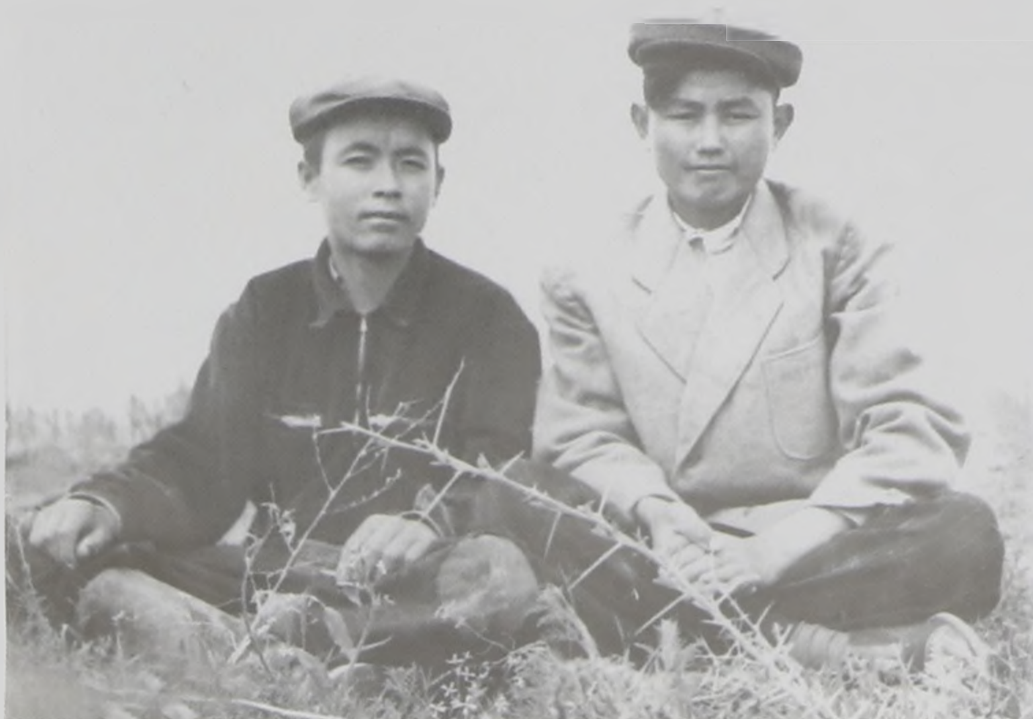
Майлыбаймен бірге. 1957 ж.