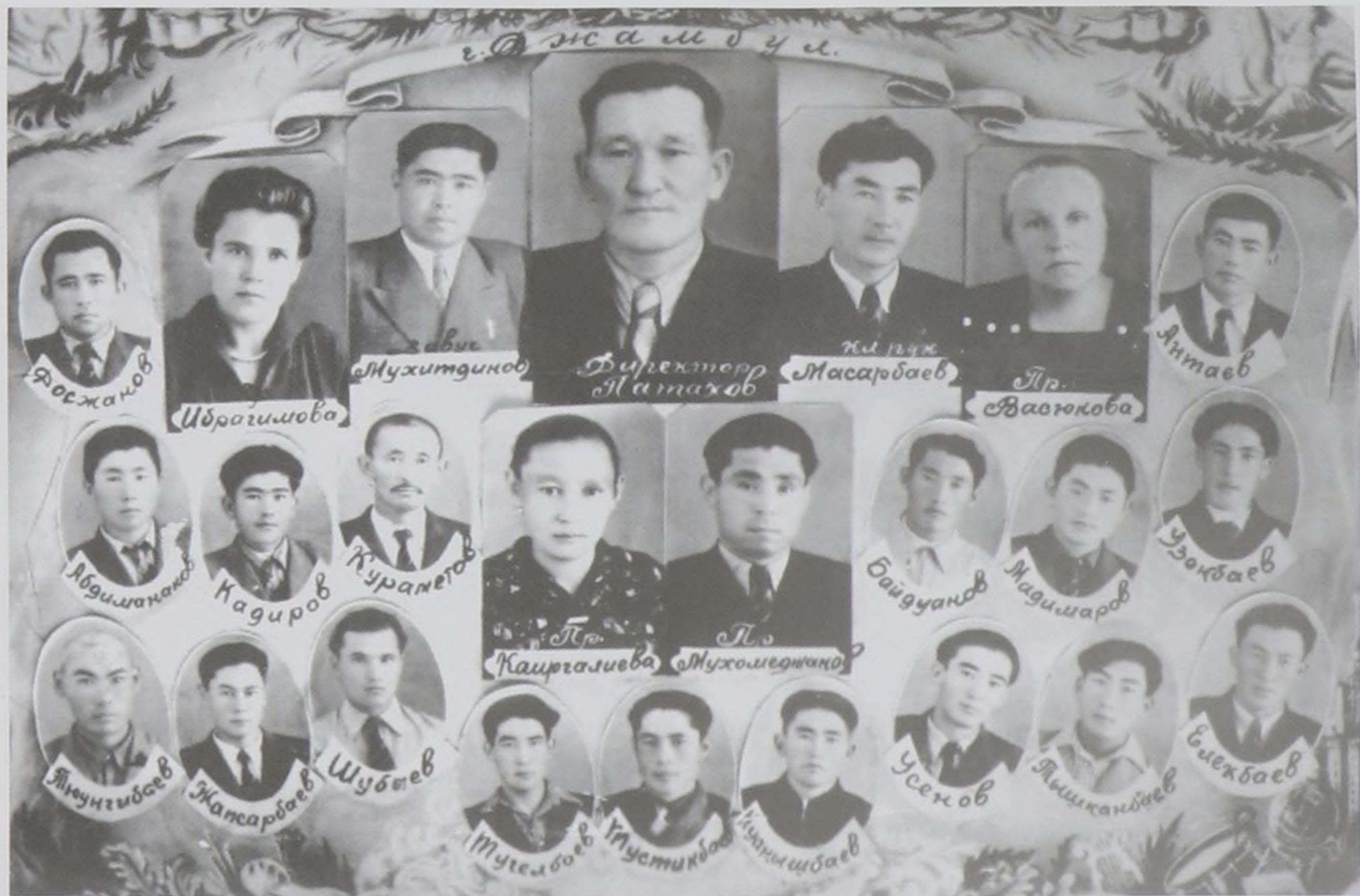
Жамбыл қаласындағы ауылшаруашылық мектебі. 1959 ж