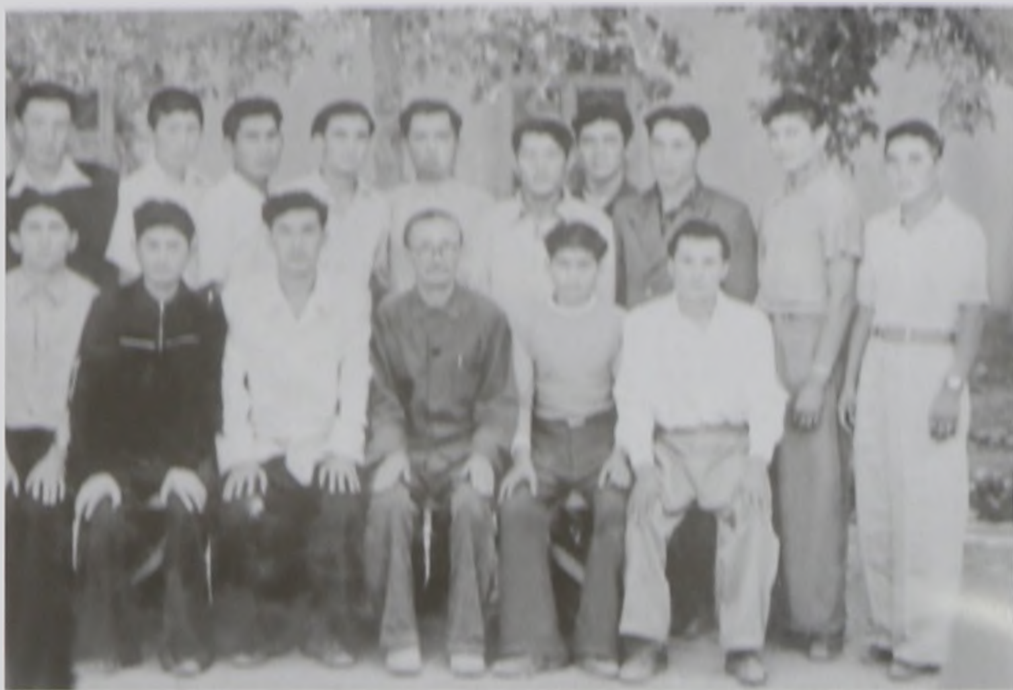
Классистарымен бірге, 1958 ж.