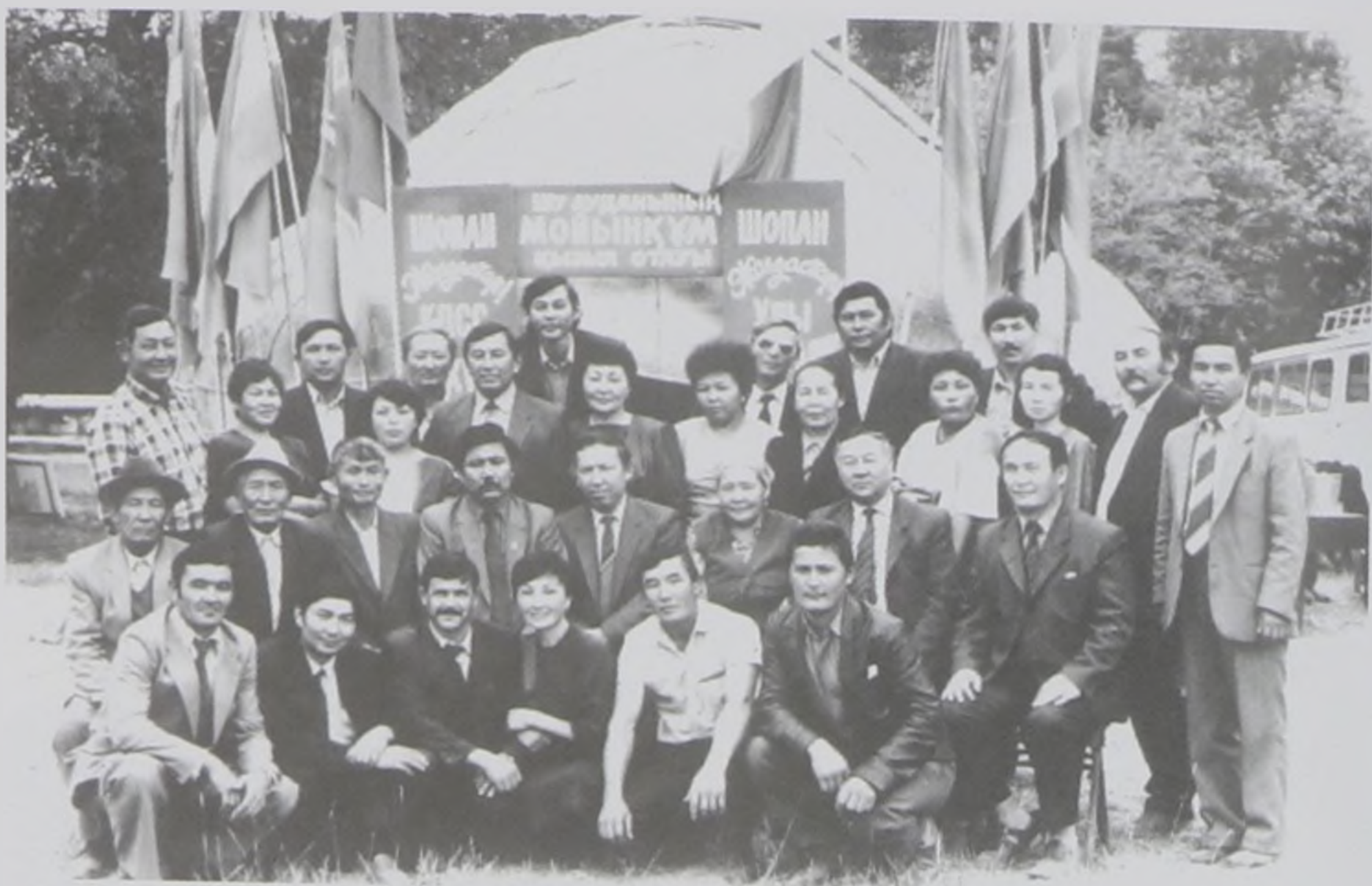
“Қызыл отау” облыстық байқауында. 1987 ж.