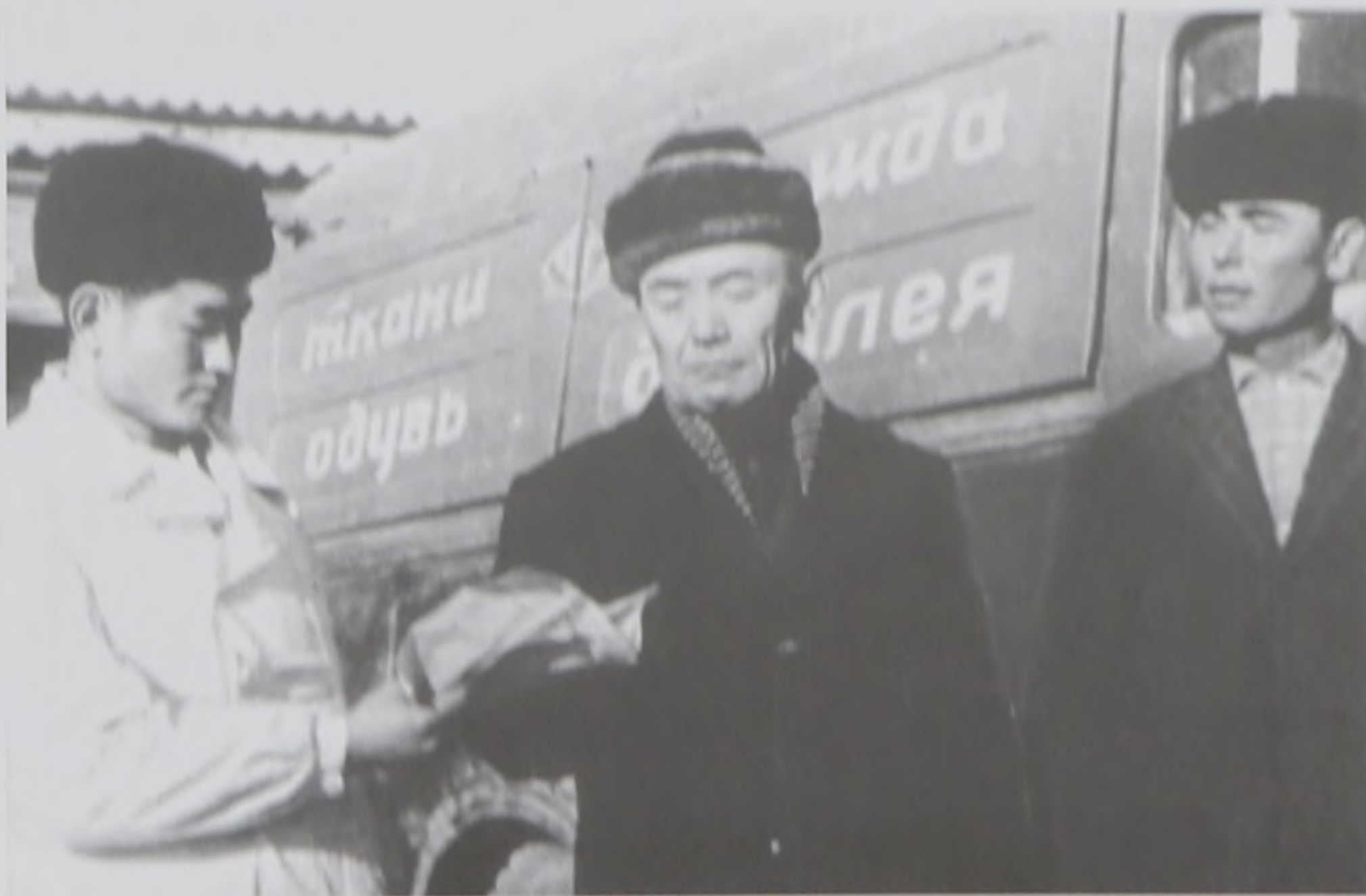
Жумас орнамди, 1967 ж.