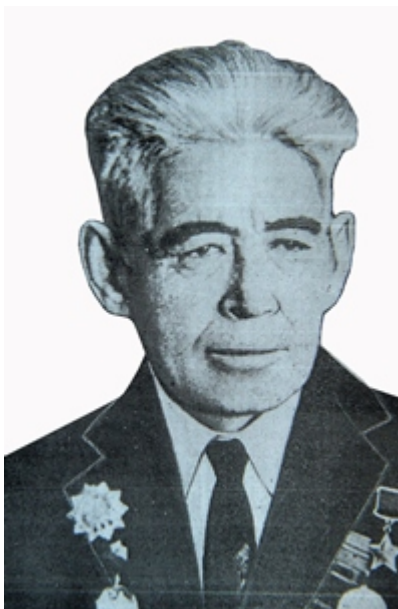
Кеңес Одағының Батыры Оразақ Ақбауов