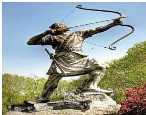
* * * Түске тарта Иран