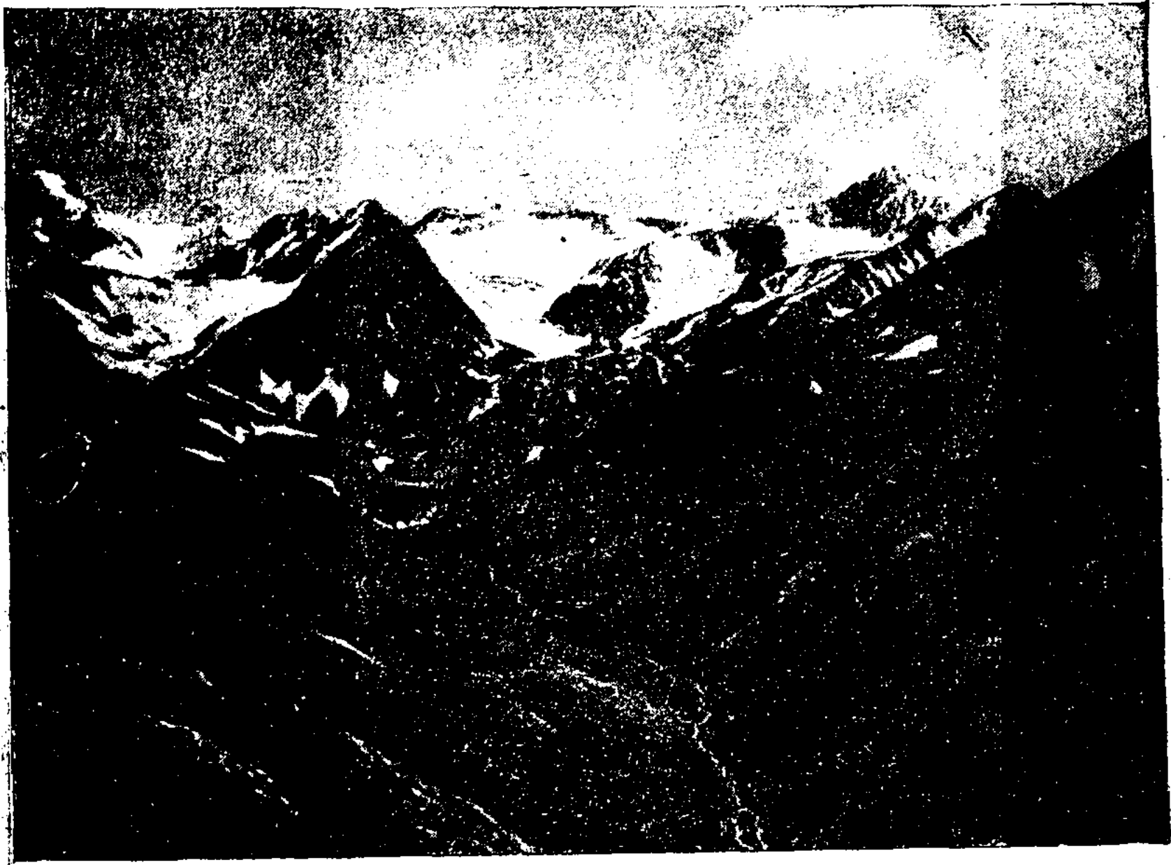
Рис. 2. Истоки р. Джебоглы-су в Таласском Ала-тау.

Геологическое строение Таласского Ала-тау и роль последнего в формировании прилежащих равнин и предгорий были изучены еще С. С. Неуструевым [2]. Преобладающей породой как в самом хребте, так и в его отрогах являются палеозойские известняки. К этой основе прилегает пестроцветная толща меловых и третичных пород, из которых образуются предгорья. Они сложены конгломератами, песчани-