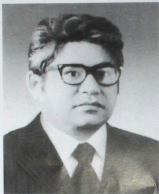
Белгілі қоғам қайраткері, ғалым Мұхамбетқазы Тәжин