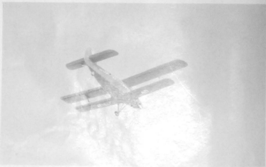
Өуеден құттықтау қағаздарын шашқан ұшақ