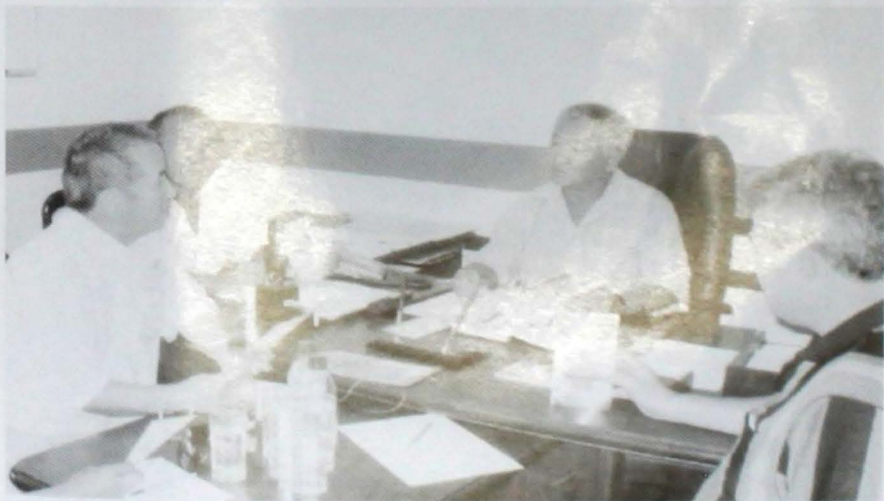
Ақтөбе қаласындағы ұйымдастыру алқасы жұмыс үстінде