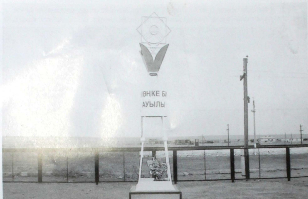
Мөңке би ауылының белгісі. Белгіні орнатқан Есенғали Жүгінісов