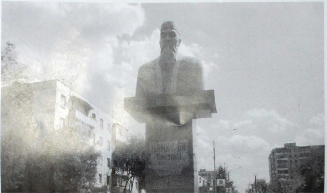
Мөңке бидің Ақтөбе қаласындағы ескерткіші. (Мүсінші Қ. Егізбай)