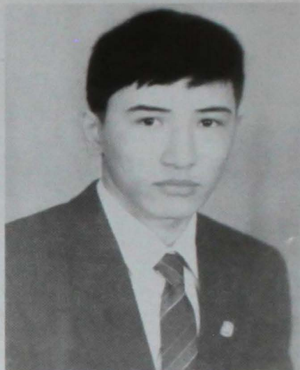
Бокстан СССР спорт шебері Нұрлан Маштиев