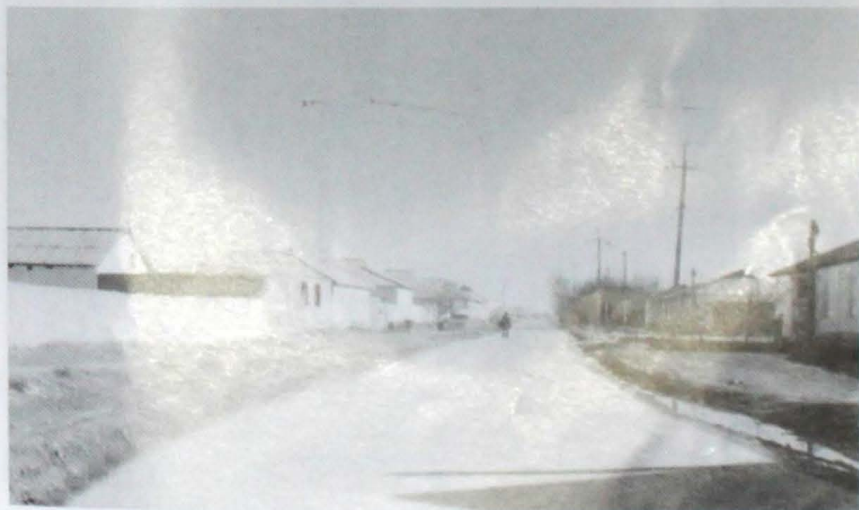
Түркістандағы Шекті Тілеу, Жолдыаяқ батырлар атындағы көше