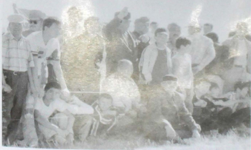
Ауыл адамдары той үстінде