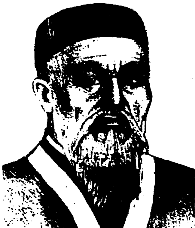
Шекті Мөнке би Тілеуұлы (1675-1756)