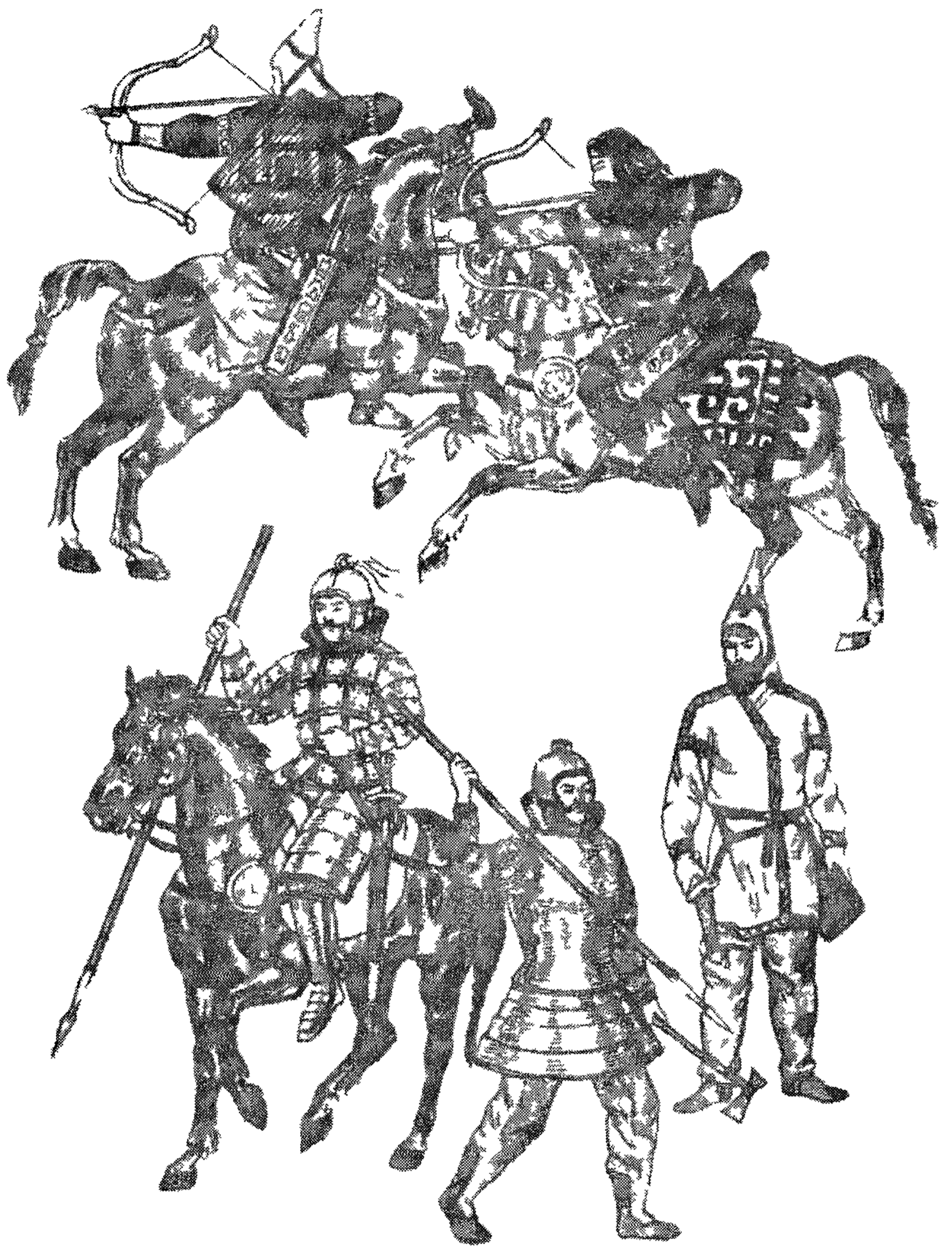
Древние сакские воины V—III вв до н э