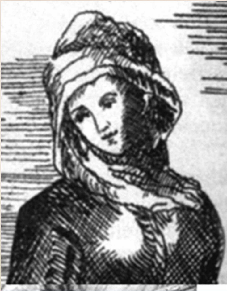
Бопай ханым. Суретті салған ағылшын саяхатшы-суретшісі Джон Кэстль, 1736 ж.