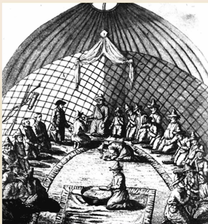
Әбілқайыр ханның қабылдауы. Джон Кэстль. 1736