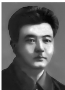
Жандосов Ораз (1899-1938)