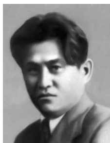
Жүргенов Темірбек (1898-1938)