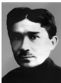
Асфендияров Санжар (1889-1938)