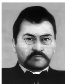
Байтұрсынов Ахмет (1873-1937)