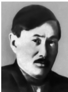
Жаманмұрынов Тель (1893-1937)