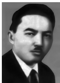
Аймауытов Жүсіпбек (1889-1930)

Л. Мирзоянның Мәскеуден үсті-үстіне лимит сұрауымен атылып кеткен халық комиссарларының бір тобы: