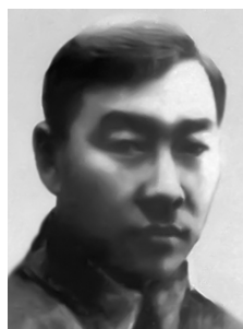
Исаев Ораз (1899-1938)