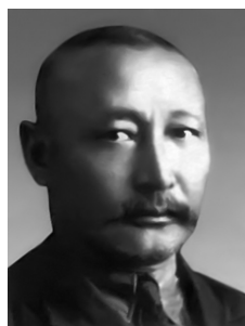
Иралин Нұртаза (1882*-1938)