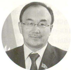
Ерлан Сыдыков, ректор Евразийского на- ционального университета, председатель Националь- ного конгресса историков Казахстана