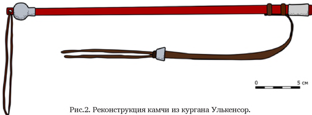
Рис.2. Реконструкция камчи из кургана Улькенсор.

(Серым цветом показаны детали из рога; коричневым цветом вероятное положение ремней; бордовым – рукоять из таволги. Автор реконструкции – С.А. Ярыгин)