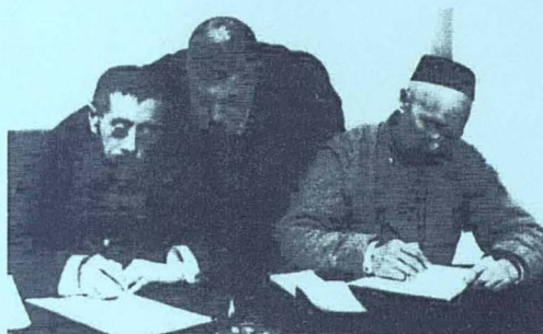
Бақытжан Қаратаев пен Темірғали Нүрекенов II Мемлекеттік дума депутаты анкетасын толтыруда. С.-Петербург, Таврия сарайы, ақпан 1907 ж.