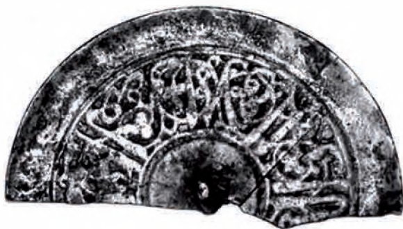
Рис. 8. Зеркало с арабской надписью: «Славы и успеха, и счастья!». Западный рабад городища Талгар. XII – начало XIII в.

В этот растительный орнамент вплетена благопожелательная надпись, испол-