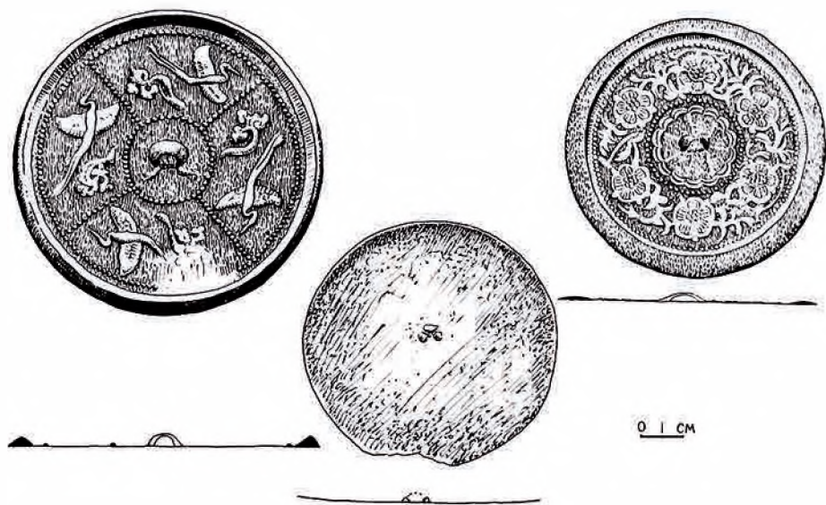
Рис. 5. Три бронзовых зеркала. «Дом ювелира», прорисовка.