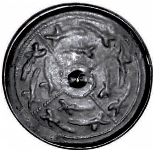
Рис. 6. Зеркало с нечетким орнаментом (12 птиц). «Дом торевта», городище Талгар. XII – начало XIII в.