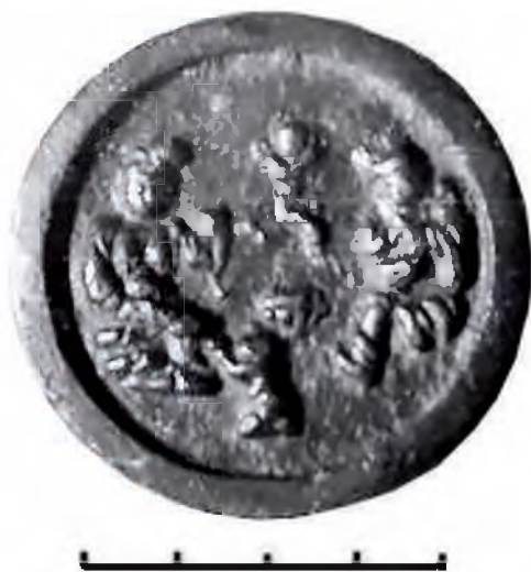
Рис. 9. Китайское зеркало, династия Цзинь. Городище Талгар, точное место находки его И.И. Копыловым не известно.

Основываясь на материалах новой монографии по китайским зеркалам Евразии, можно уверенно говорить о том, что зеркало (диаметр 75 мм; Приморский край, РФ) относится к династии Цзинь (1115–1234 гг.). Сюжет: почитание и уважение родителей детьми. На зеркале из Приморья по бортику выбита плохо