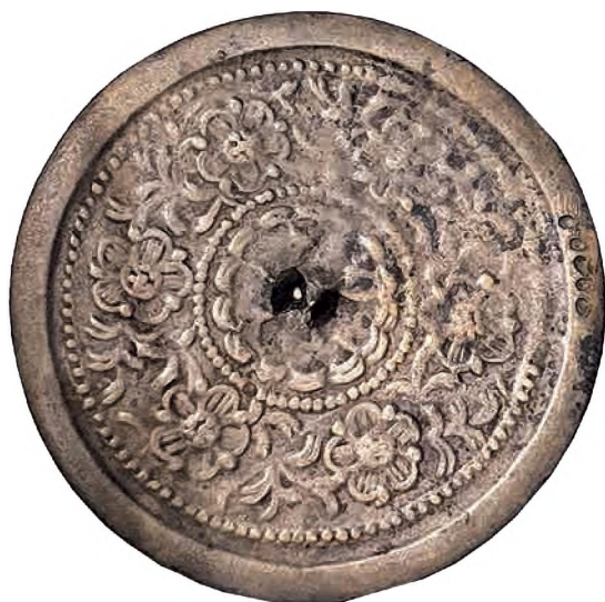
Рис. 3. Зеркало с растительным (китайским) орнаментом. «Дом ювелира», городище Талгар. Конец XI – начало XIII в.

Экспозиция музея «Центр сближения культур» под эгидой ЮНЕСКО.