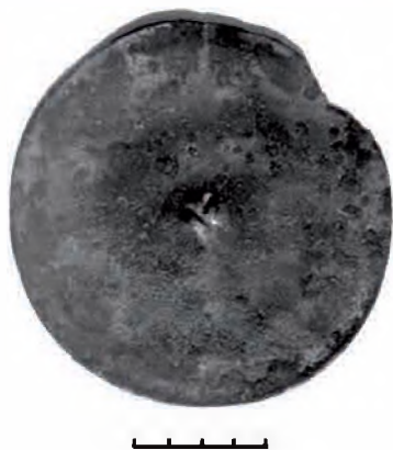
Рис. 2. Зеркало без орнаментации. «Дом ювелира», городище Талгар. XII – начало XIII в.

Первое зеркало (рис. 2) из «дома ювелира» (диаметр – 118 мм, толщина – 1,5–2,0 мм, вес – 89,4 г) имеет форму не идеально круглого диска, лицевая сторона немного выпуклая. На тыльной стороне в центре расположен держатель полусферической формы, верхняя часть которого отбита. Сквозное отверстие держателя для шнура или ленты имеет диаметр 2,5–3,0 мм. Кромка зеркала имеет утолщение не более 1–1,5 мм. Зеркало лишено