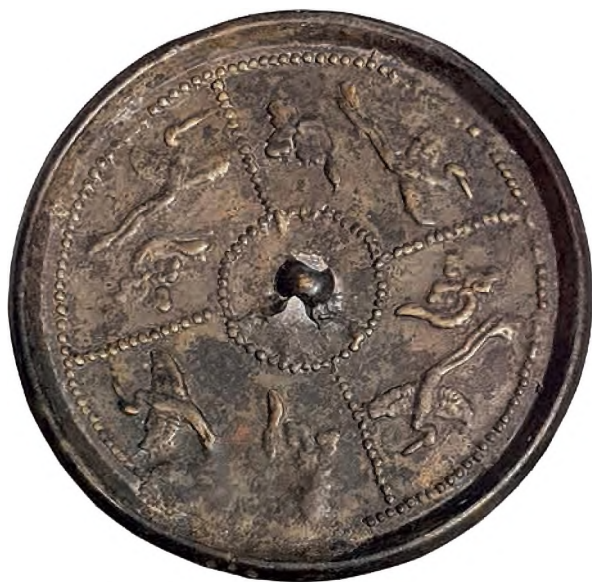
Рис. 4. Зеркало с растительно-орнитоморфным (китайским свадебным) орнаментом. «Дом ювелира», городище Талгар. XII – начало XIII в. Экспозиция музея «Центр сближения культур» под эгидой ЮНЕСКО.

его 241,95 г. Внешняя грань диска оконтурена бортиком, имеющим в разрезе форму равнобедренного треугольника с размерами сторон: основание – 0,8 см, внешней грани 0,5–0,6 см. В центре внутренней плоскости помещен держатель полусферической формы высотой 0,8 см со сквозным отверстием размерами 0,4×0,5 см. Вся внутренняя плоскость заполнена рельефно отлитым нечетким (выделено нами – прим. авт.) орнаментом. На расстоянии 0,6 см от держателя помещен круг диаметра 3 см, составленный из 40 точек. От него отходят вверх прямые линии длиной 3,5 см, состоящие из 13–15 точек, доходящие до внутренней грани большого бордюрного круга