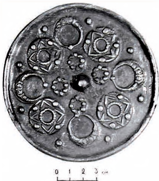
Рис. 7. Зеркало «с медальонами» (среднеазиатский орнамент). Соседнее жилище с «домом торевта», городище Талгар. XII – начало XIII в.

Fig. 7. Mirror "with medallions" (Central Asian ornament). Neighboring dwelling with the "House of Torewt", Talgar site. 12 th – beginning of 13 th centuries.