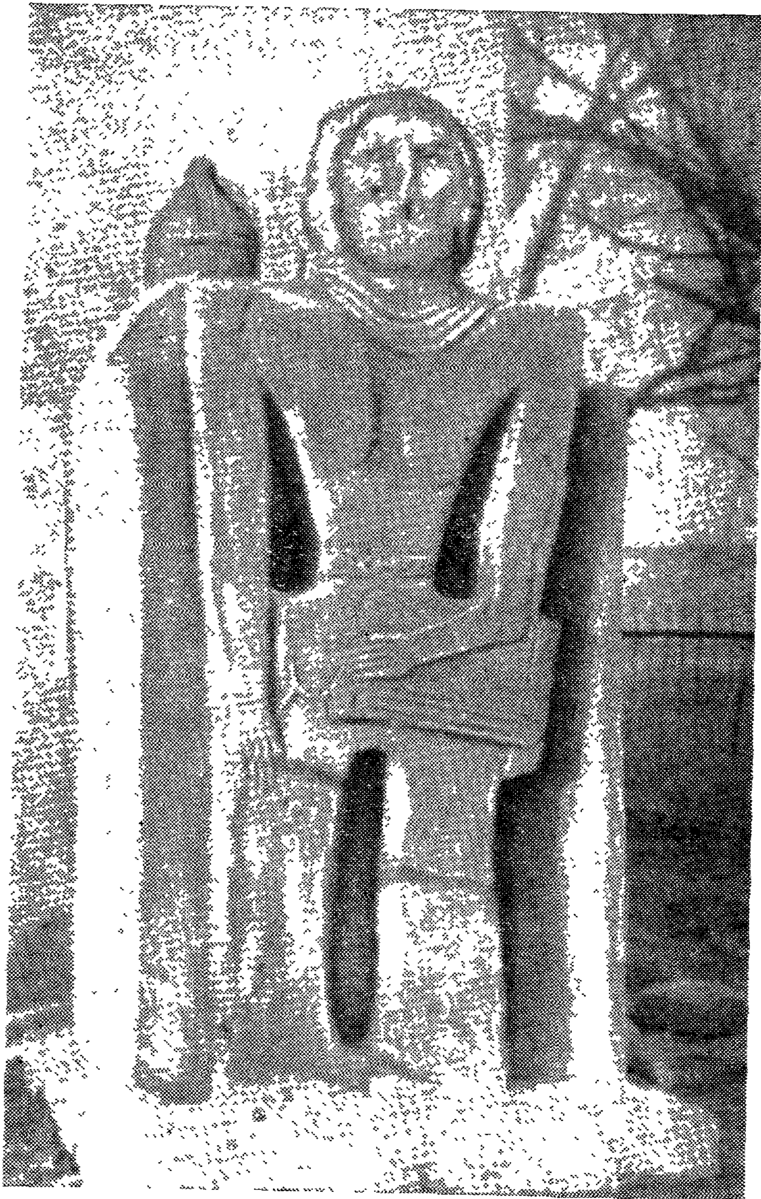
Қондыбай үйінен табылған мүсін