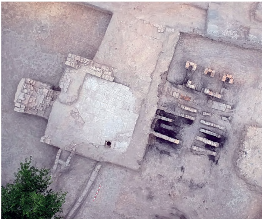
Рис. 2. Баня (вид сверху)

чей, уложенных в один ряд кладки. Размер кирпичей 26x15x5 см. Толщина северной стены помещения равна 0,75 м, остальных стен 0,65 см (северная стена внешняя).