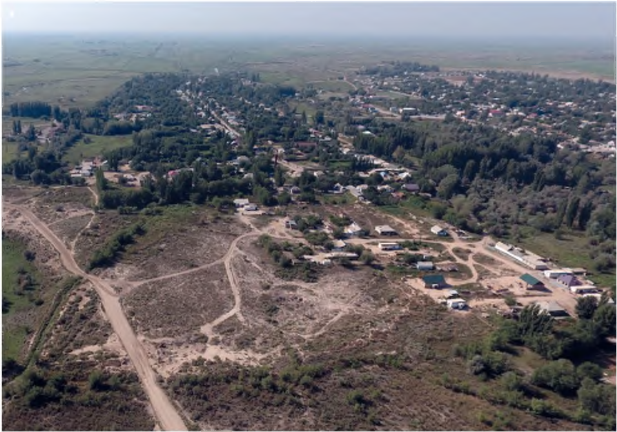
Рис. 1. Аэрофото цитадели городища Ипанбалык (вид на юго-запад)

поверхности которого были зафиксированы обломки от жженных кирпичей и несколько фрагментов боковин от хумов. Общая глубина раскопа составила 1,5 м.