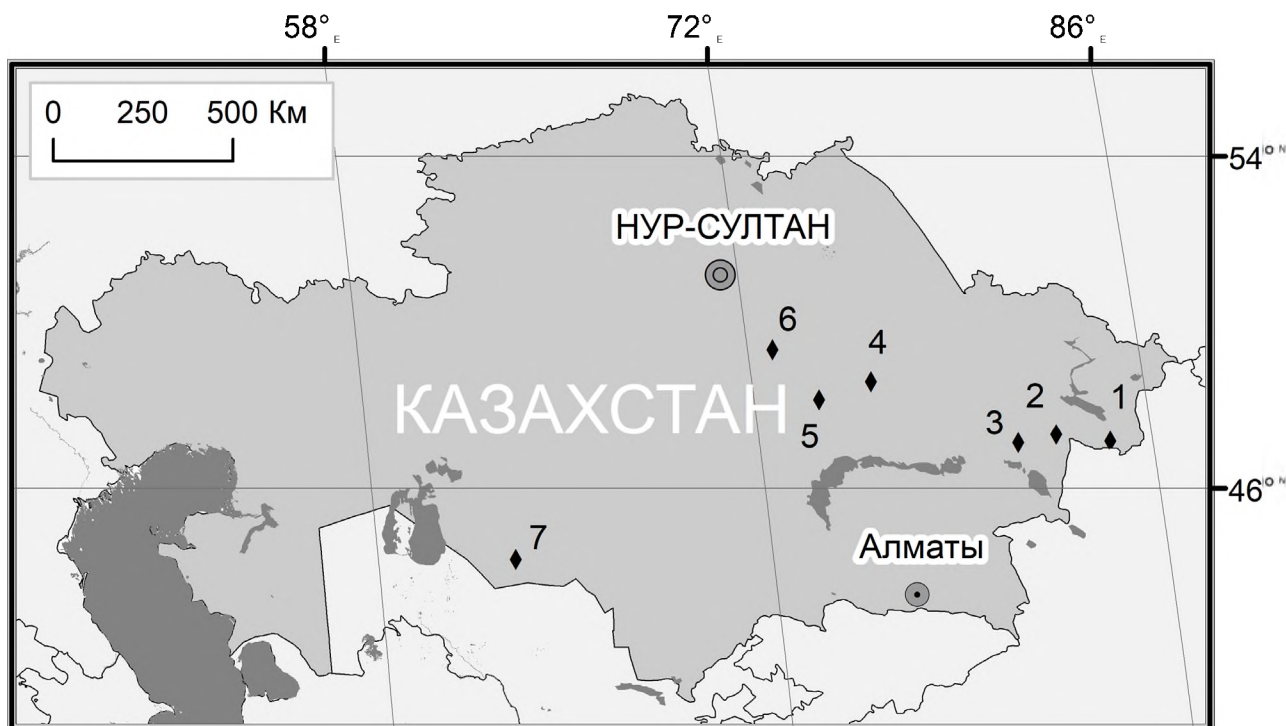
Рис. 1. Расположение анализируемых памятников на карте Казахстана. 1 – Шиликты; 2 – Елеке сазы; 3 – Тасарык; 4 – Талды-2; 5 – Карашоки; 6 – Шерубай; 7 – Южный Тагискен. Карту подготовил М.А. Антонов