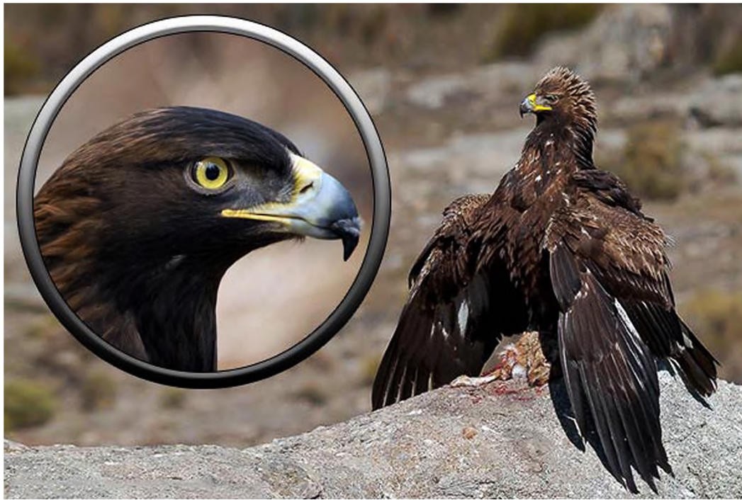
Рис. 3: Беркут (по: [Мир птиц...])

назад головой в пределах контура туловища, профильное с прямо поставленной головой, птица в состоянии полета/парящая (в том числе как элемент композиции), сильно стилизованное изображение птицы, профильное. Можно сказать, что профильные изображения – однозначно хищные птицы. Зубчатые края аппликаций, рельефные выступы по краям пластин, обойм, очевидно, передают оперенье птиц в определенном состоянии (рис. 3).