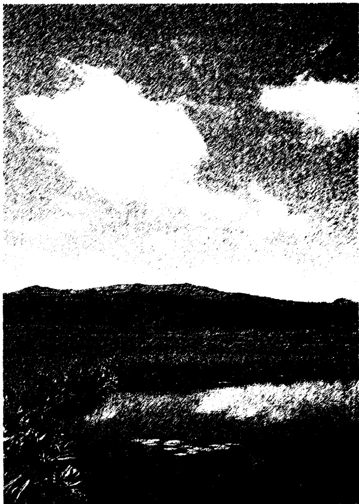
І және қияттама басқармасының Ж.Молда